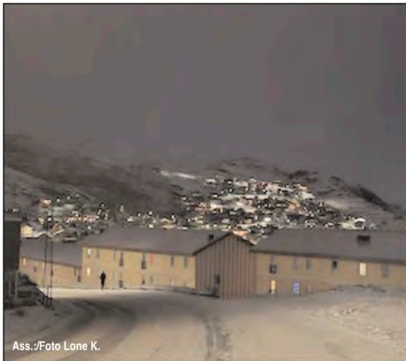
Ass.:/Foto Lone K.

www.kujataamiu.gl • mail: kujataamiu@gmail.com